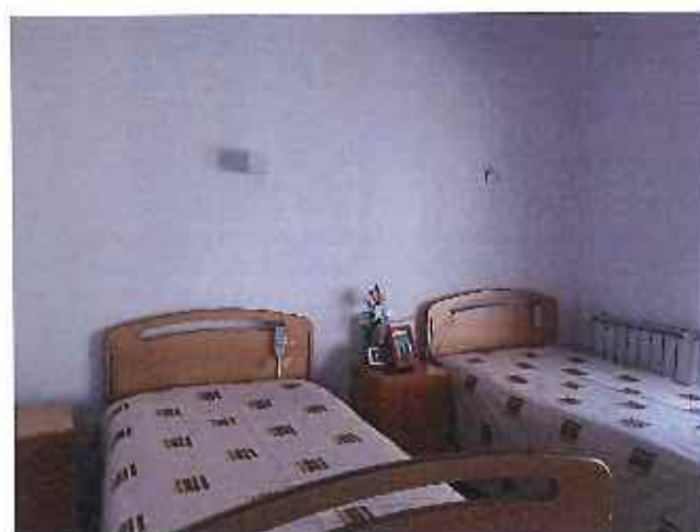
Requalificação da Ala Antiga do Lar (quarto duplo)