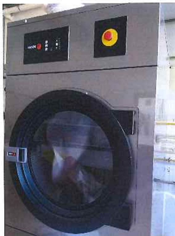
Aquisição de Secador de Roupa