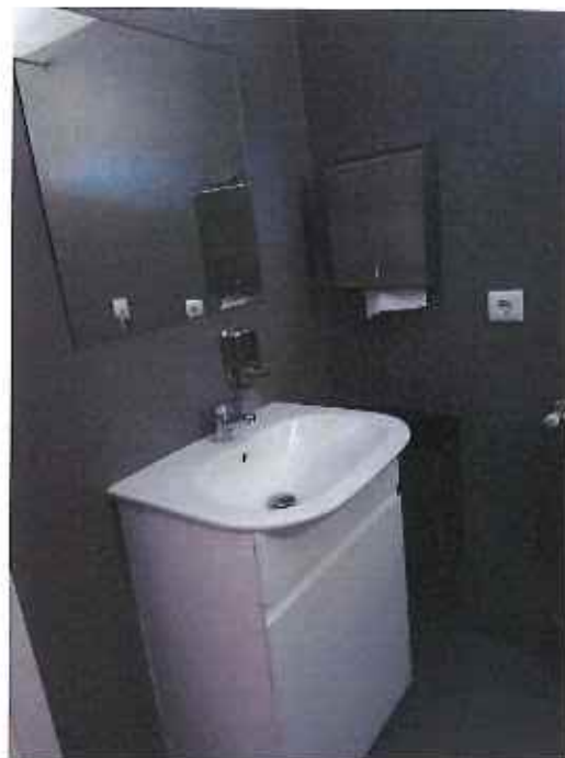
Requalificação da Ala Antiga do Lar (we quarto duplo)