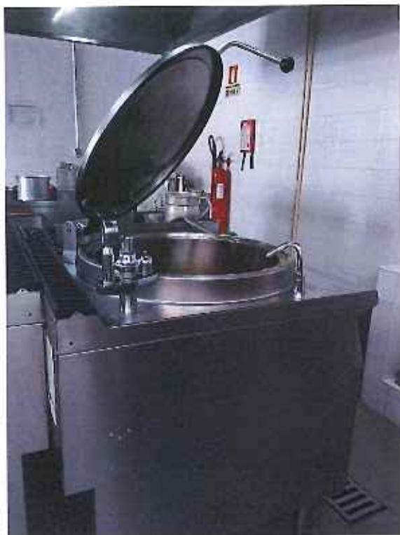
Aquisição de Marmita Industrial