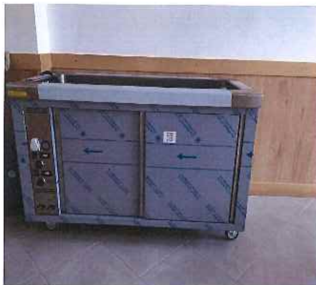
Aquisição de Banho Maria