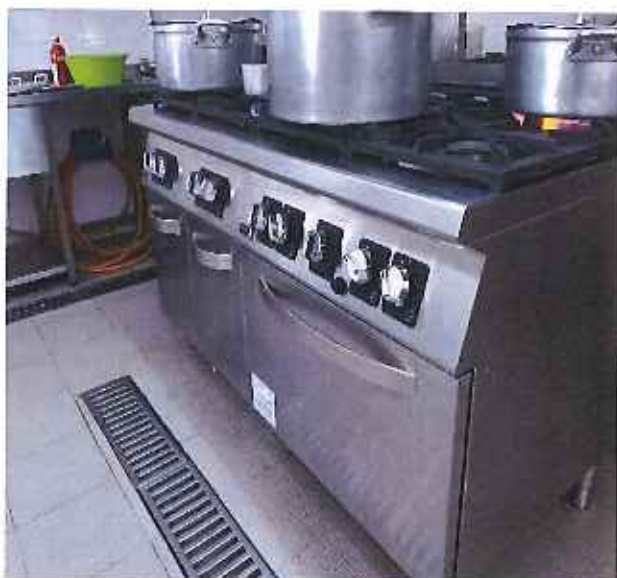
Aquisição de Fogão Industrial