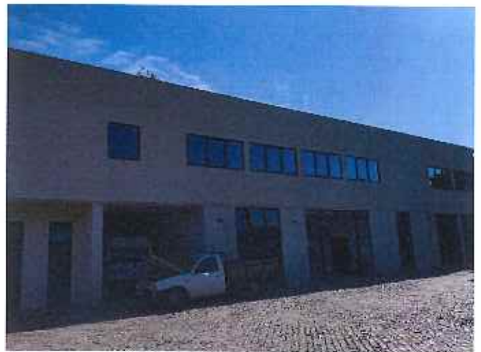
Construção da Sala de Atividades de Centro de Dia

Independentemente do investimento referido através da candidatura “Requalificação/Remodulação da Ala Antiga da ERPT”, com o código NORTE-07-4842-FEDER 000067 o Centro Social teve que suportar o custo da execução de obras e adquirir equipamentos complementares à candidatura NORTE 2020, bem como proceder a adaptações de espaços, aquisição de equipamentos e outros bens por força da pandemia COVID-19, cujo montante atingiu o valor global de 39.387,01 €. Refira-se ainda outros investimentos que se executaram no ano de 2020, no montante de 66.837,98€.