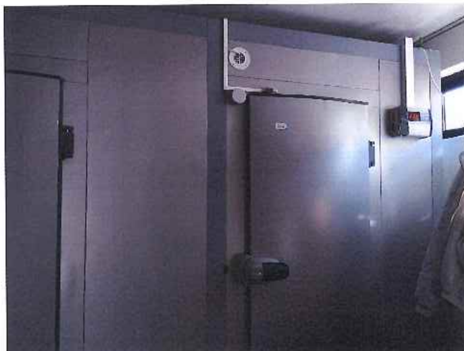
Aquisição de Câmara frigorífica de conservação e congelação