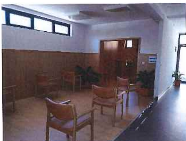
Requalificação da Ala Antiga do Lar (espaço de recolhimento)